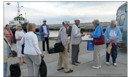
19.00 Jõuame Ruhnu