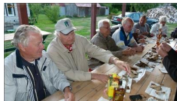
20.00 Lestade söömine