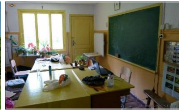
15.00 Teel Limo randa tutvume kohaliku koolimaja