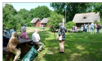
Teeme külale tiiru