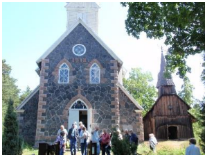
Vana ja uus kirik