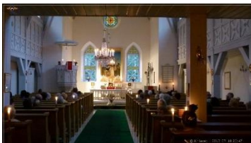
20.15 Seame sammud kirikuse, siis «öömüts»