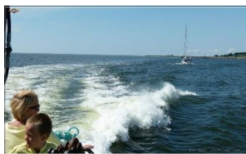
19... Tallinn paistab