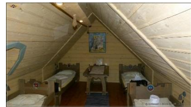
...üks näide: 4 voodit