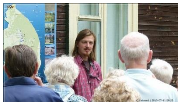
9.30 Saare ajalugu