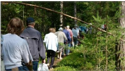
Matk jätkus läbi metsa