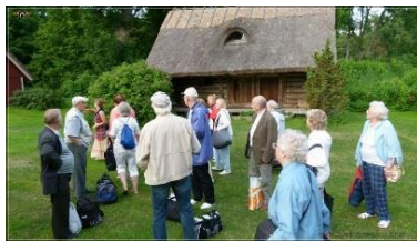
19.30 Tubade jagamine