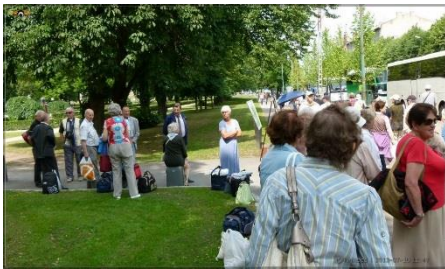
14.00 Kogunemine linnas