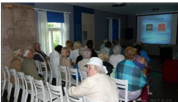
17.00 Rahvamajas kaks filmi Ruhnust