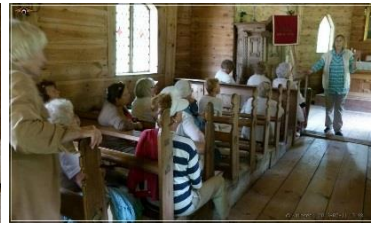
Kuulame lugusid mõlemast kirikust