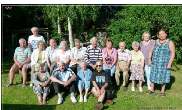
Teeme viimsed pildid