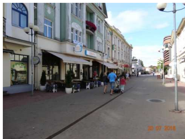
Tänav jalutamiseks ja ostudeks

Linna üks suurimaid väärtusi on selle unikaalne puitarhitektuur. Olles teadlik esteetilisest atraktiivsusest ja materjali sobivusest hooajalise laadiga majade ehitamiseks ning hinnates ka puidu positiivseid omadusi ja mõju inimese tervisele ja keskkonnale, ehitati 19. sajandil ja 20. sajandi esimesel poolel Jūrmalas enamik maju puidust ning seetõttu domineerib puitarhitektuur teist tüüpi hoonete üle Jūrmalas