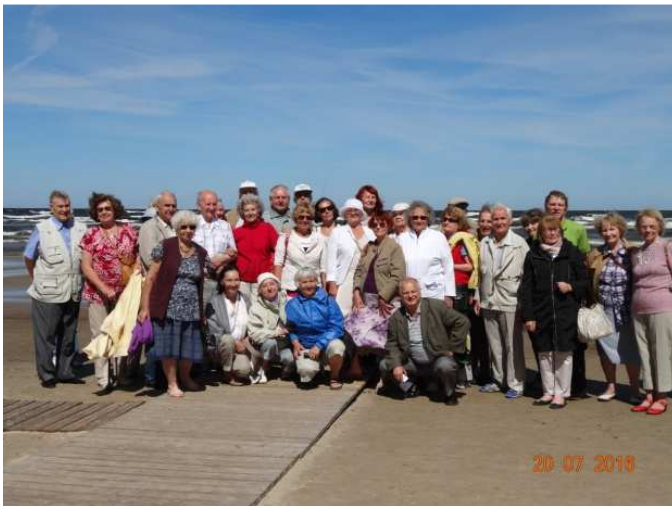
Meie seltskond 2. päeva hommikul