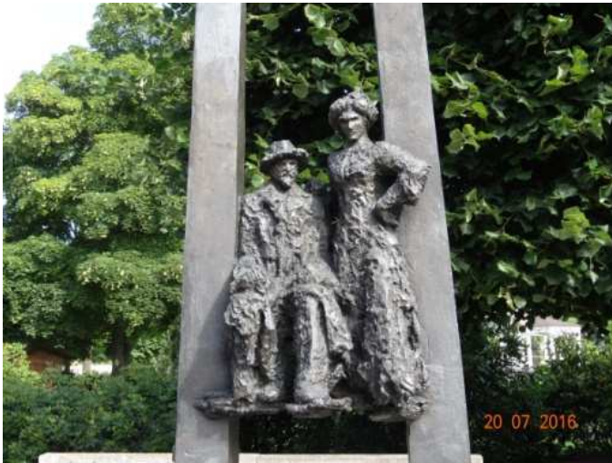
Aspazijai ja Rainimäe kujud