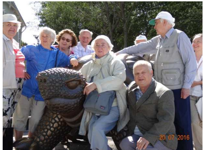
Vaene kilpkonn ja veel rohkesti huvitavat